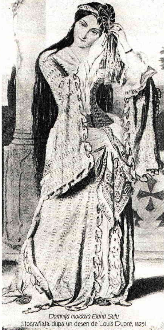
Domnița moldava Elana Sufu (litografiată după un desen de Louis Dupré, 1825)